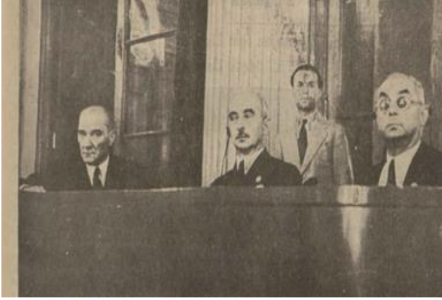
Tan , 22 Eylül 1937.

"Başvekil Malatya Mebusu İsmet İnönü'ye, talep ve ricası üzerine, Reisicumhur Atatürk tarafından bir buçuk ay mezuniyet verilmiş ve Başvekâlet vekaletine İktisat Vekili Celal Bayar tayin edilmiştir." 19