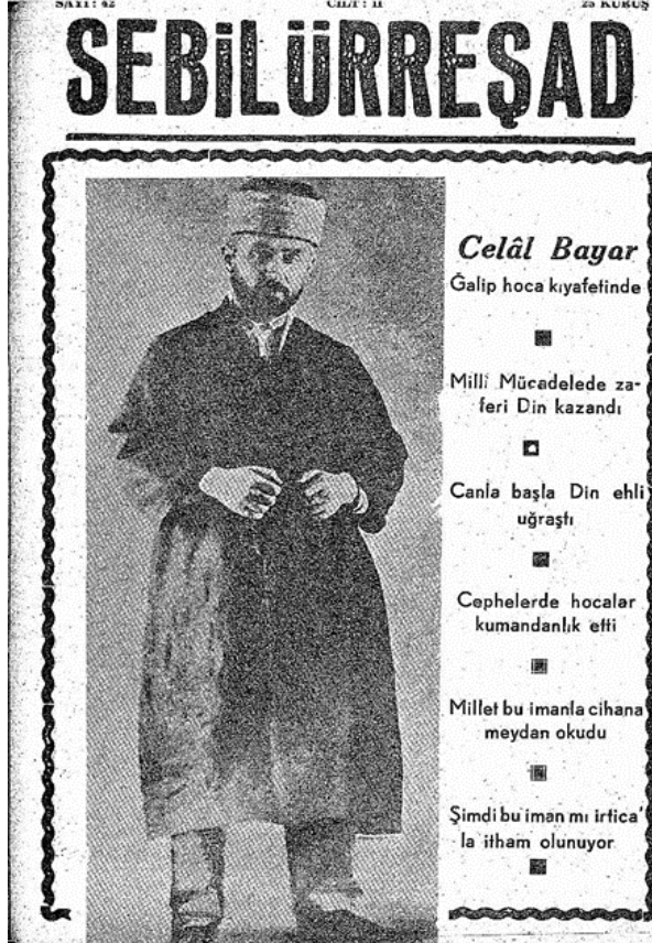
Millî Mücadele'de Galip Hoca (Celâl Bayar) (cilt:2, sayı:42, 1949)

İstiklal Harbi'ndeki hizmetlerinden dolayı kendisine "Kırmızı-Yeşil Şeritli İstiklal Madalyası" verilmiştir 3 .