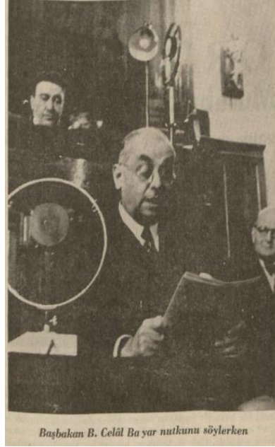
Ulus, 9 Sontesrin 1937.

25 Eylül 1937 tarihinde Reiscumhur Mustafa Kemal Atatürk başkanlığında toplanan İcra Vekilleri Heyeti yeni dönem çalışmaları hakkında görüşmeler yapmıştır. Celal Bayar'ın ilk Türkiye Cumhuriyeti'nin dokuzuncu hükümetinde yer alan üyeler şöyledir 29 :